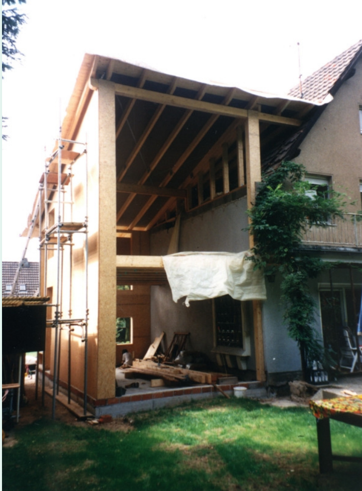
Die Holzkonstruktion im Bau